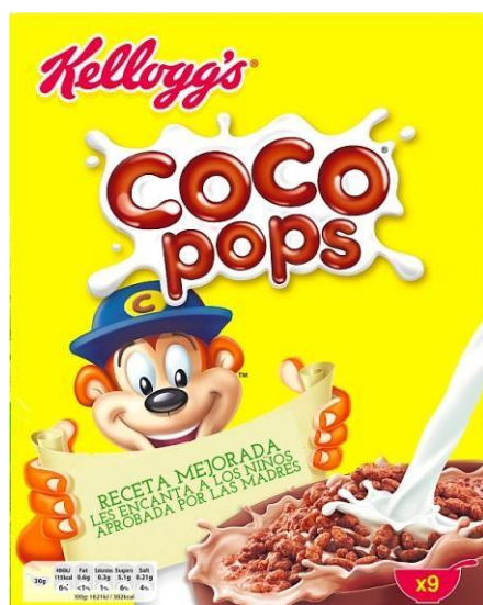
Il·lustració 2: Cartell Coco Pops traduït

El format serà el d'un examen habitual amb preguntes de tot tipus, entre les quals es trobarà el cartell publicitari dels Coco Pops , eslògan del qual s'ha traduït de la llengua anglesa 23 a la castellana per tal que l'alumnat l'analitzi.