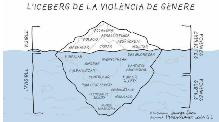
Il·lustració 1: Violència de gènere

troben en la base de l'iceberg de violències masclistes 8 , metàfora sovint utilitzada per les persones expertes que desitgen donar visibilitat a totes les formes de masclisme, tant encobert com evident.