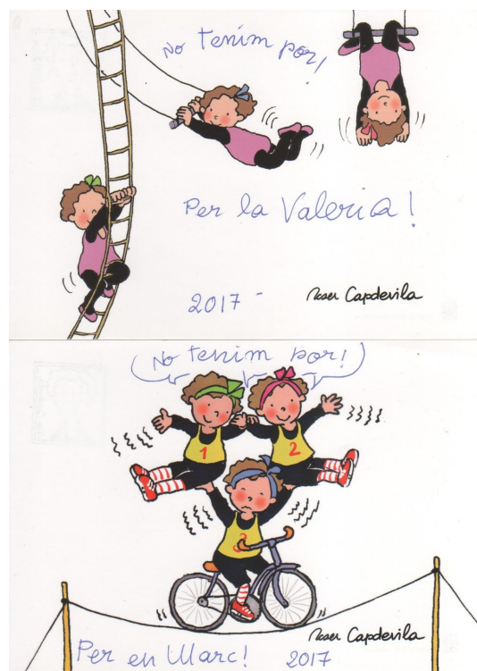
Regal de Roser Capdevila pocs dies després dels atemptats del 17 d'agost de 2017 de Barcelona i Cambrils