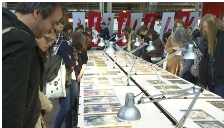
Fira de Bolonya 2017

En un àmbit més proper, destacaria la Fira del Llibre Infantil i Juvenil de Mollerussa 6 . El veritable paradís de l'àlbum il·lustrat és la Fira del Llibre Infantil i Juvenil de Bolonya , on editors, il·lustradors, dissenyadors, biblioteques, escoles d'art i tots els professionals del sector es troben cada any. Catalunya i les Illes Balears van ser els convidats d'honor de la 54a edició de la Fira , i participaren amb una exposició central dedicada a la il·lustració, un estand col·lectiu que va acollir editorials i il·lustradors i la programació de diverses activitats, entre les quals cal destacar l'exposició "Vet aquí una vegada", que va tenir lloc a l'històric palau de l'Archiginnasio, i va mostrar una selecció de treballs de 17 dibuixants consolidats i representatius de la il·lustració catalana de les últimes cinc dècades, com ara Mercè Llimona, Pilarín Bayés, Max i Arnal Ballester, entre d'altres.