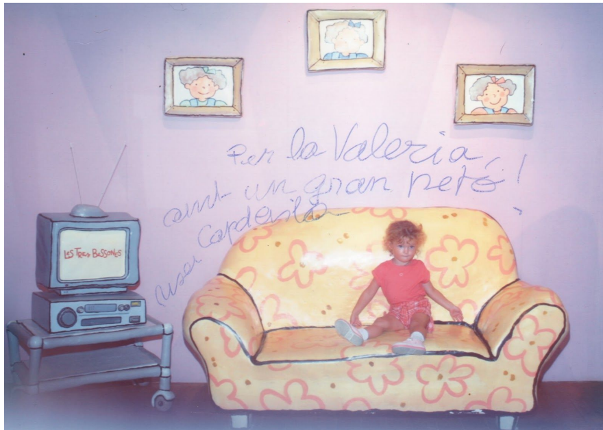
Valèria a la caseta de les Tres bessones. Tibidabo, 7 d'agost de 2002