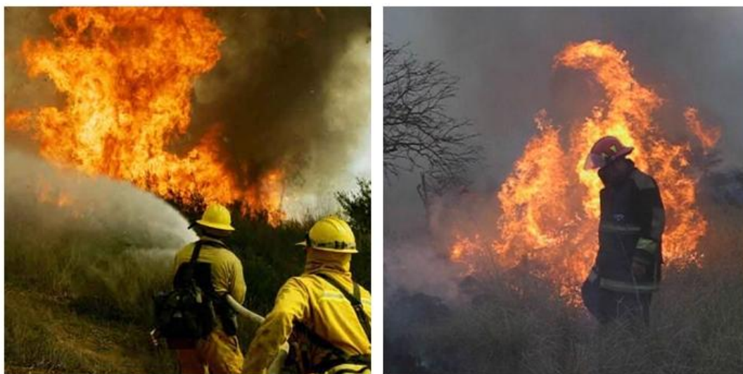
Fig.3 Bombers en acció

Confirmant-se aquest perfil amb un altre estudi dut a terme posteriorment també per Gomà i Puyane (1991) on 27 alpinistes, 72 esportistes de muntanya