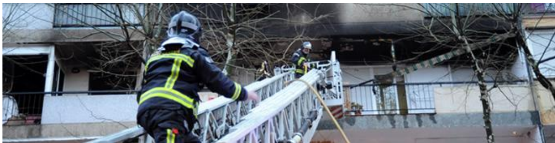
Fig.12 Bombers en una casa cremada

Al parlar-li de la valoració que havíem fet a la part teòrica del risc ens va comentar que el risc físic probablement era el que més es veia i que no es