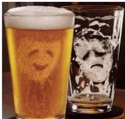
Fig.7 "Me siento mejor después de tomarme un par de copas"- pregunta 36B de l'Escala de Recerca de Sensacions.

Segons Gracia i Saldívar-Garduño una persona amb una necessitat alta de recerca de sensacions prefereix una contínua font externa d'estimulació cerebral, l'avorreix la rutina, y està sempre buscant maneres d'augmentar l'activació mitjançant experiències excitants. En canvi, una persona baixa en recerca de sensacions prefereix menys estimulació cerebral i tolera la rutina bastant bé.