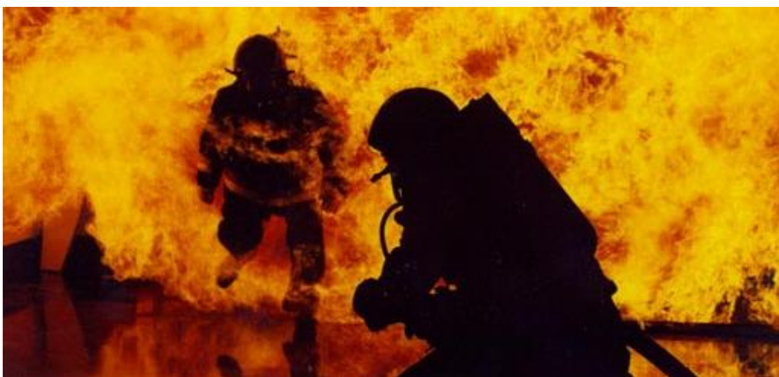
Fig.13 “Et pot venir de cinc minuts de salvar-te o no”

“Quan hi ha un incendi et pot venir de cinc minuts de salvar-te o no. Per això és vital el grup”- Tot ensenyant-nos un vídeo d'un incendi a una granja on el company que s'havia quedat a baix esperant quan veu que els altres no surten i el foc s'aviva corre a posar una altra barrera d'aigua.