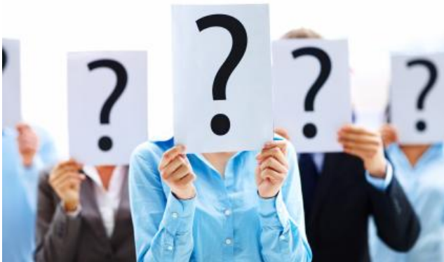
Fig.2 “Les persones es poden incloure en un tipus de personalitat concret però mai hi coincidiràn plenament”

Això també implica la disposició a comportar-se d’una manera semblant en varies circumstàncies. Per això és possible fer prediccions sobre la nostra conducta i la dels demés.