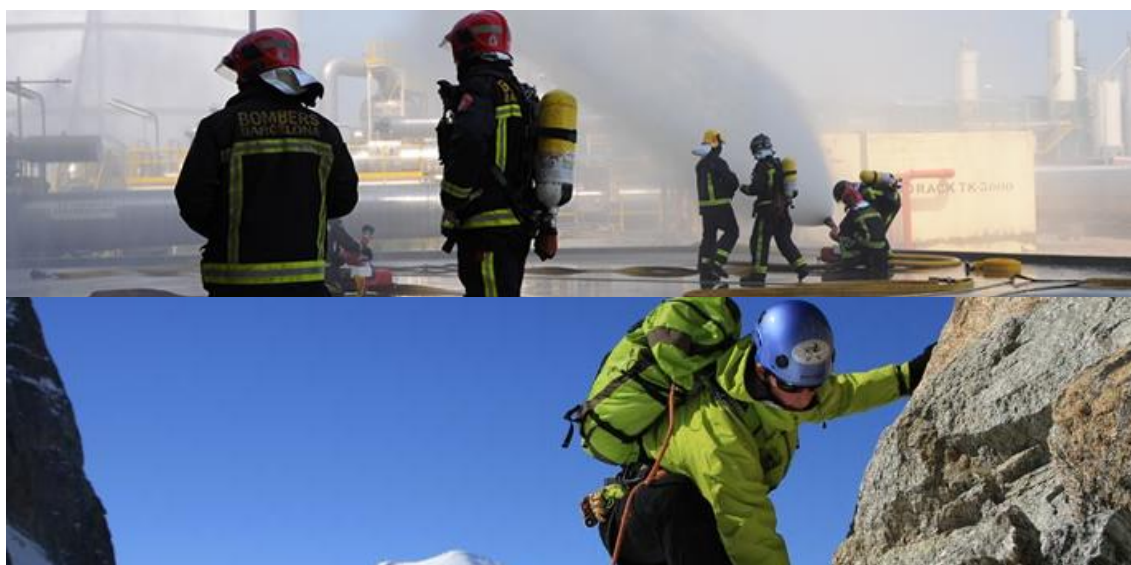
Fig.6 Grups de l'estudi