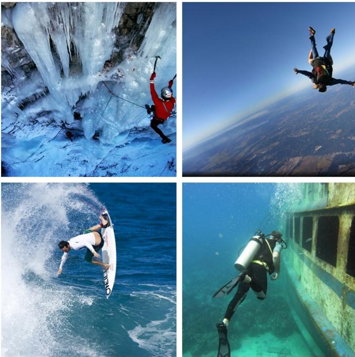
Fig.4 Diferents tipus d'esports de risc

Basant-nos amb l'estudi elaborat per Gomà i Wismeijer (2002) que va consistir en passar l'escala d' EPQ d'Eysenck i la de recerca de sensacions en forma V de Zuckerman a 20 guardaespalles obtenint com a resultats: estabilitat emocional, puntuacions baixes en psicoticisme i recerca de sensacions, una gran sinceritat i baixa susceptibilitat al avorriment.