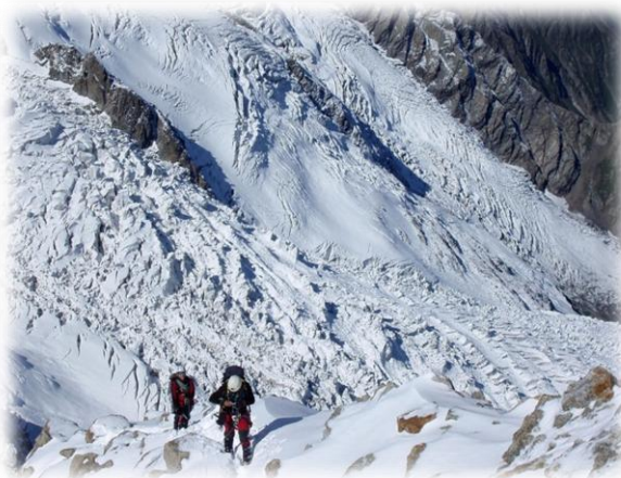
Fig.5 Els alpinistes són considerats esportistes de risc ja que s'exposen a climes adversos, forts desprendiments (allaus, roques...), manca d'oxigen i terrenys que sovint dificulten el seu pas i posen en perill la seva vida: glaceres amb escletxes, parets verticals, etc.

Existeixen diferents tipus de risc però pel tema del treball caldrà centrar-se amb el risc físic. Aquest es descriu com: “les activitats on el subjecte que la practica pot sofrir una lesió greu o fins i tot la mort” (Pedersen, 1997). Conforme amb l'estudi realitzat per Gomà (2002) es poden diferenciar les diferents activitats en antisocial i prosocial: entenent com activitat antisocial de risc la que pot fer mal als altres i la prosocial la conducta de la qual pot resultar un benefici pels demés. És a