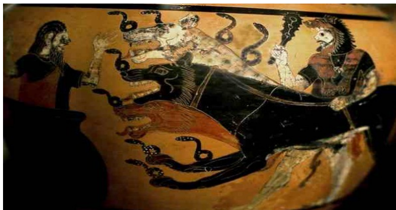
Hidria de Caere, c.540 a.C. París, Louvre.

Cèrber és un gos monstruós, fill de Tifó i Equidna, que guarda l'entrada dels inferns i impedeix que ningú pugui sortir. A vegades se'l representa amb tres caps, cua de serp i urpes de lleó. Només Orfeu va ser capaç de calmar-lo amb la seva música. Es relaciona Cèrber amb els mites d'Hèrcules i d'Orfeu.