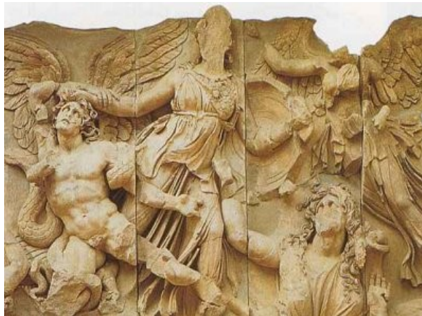
Altar de Zeus a Pèrgam. Berlin

En la saga de Harry Potter, són éssers que doblen o tripliquen les dimensions d'una persona humana normal. Es diu que tenen un caràcter hostil i agressiu. No els agrada molt dialogar ja que com que el seu volum supera a qualsevol altre, ho arreglen tot mitjançant la força. Quan les disputes són entre ells, els pobles del voltat també ho perceben ja que, el terra tremola i se senten uns sorolls poc freqüents. Viuen a les muntanyes perquè és l'únic lloc on poden amagar-se per tal de que ningú els vegi però sent lliures i vivint tal i com volen. La població dels gegants està controlada per un rei, el qual sempre ha d'estar servit pels altres. Normalment, aquest és el més gran i agressiu que es fa amb el poder matant l'anterior rei.