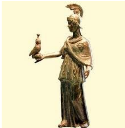
escultura romana antiga

guerra, la que en Harry Potter és encarnada com la professora McGonagall qui, cal destacar, que té una gran afinitat amb aquests ocells.