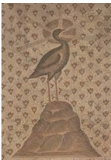
mosaic segle V, Museu del Louvre

És un au de faula que s'alimenta d'encens, viu cinc segles i reneix de les seves cendres. És un au sagrada entre els egipcis, que habita en Heliòpolis. Apareix una obra d'Ovidi. “Metamorfosis”, XV, 391-407