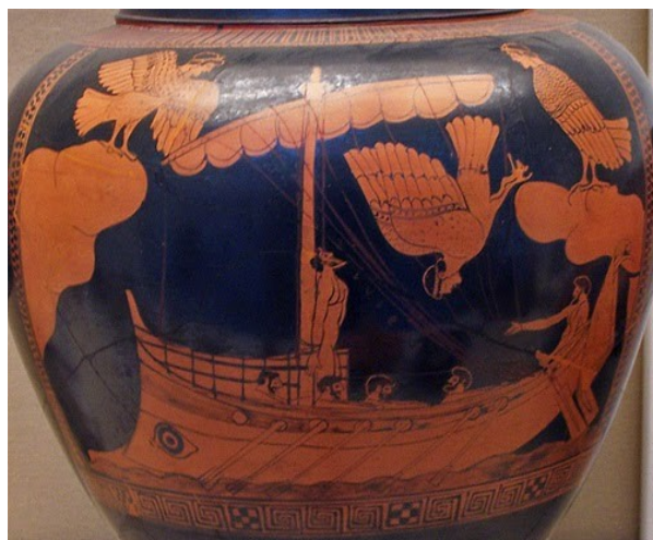
Ul·lisses i les sirenes. Estamno àtic de figures vermelles, c. 480 a.C. Londres, British Museum

El tritó és un déu del mar, fill de Neptú i d'Amfitrite. El seu cos, mig humà, acaba en cua de peix. Porta un trident amb el que amenaça quan hi ha alguna cosa que no li està bé.