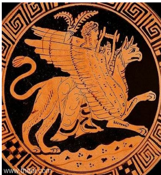
Apol·lo cavalcant a sobre d'un grif. Copa àtica, c. 380 a.C. Viena, Kunsthistorisches museum

És un animal fantàstic, un hipògrif, que en Hagrid ha cuidat des de petit. És meitat àliga i meitat cavall. És un animal molt orgullós, motiu pel qual s'ha de fer una reverència abans de pujar al seu llom. El hipogrifs tenen la capacitat de volar molt alt, sense cansar-se, durant hores i a més la seva condició de cavall també els permet de córrer ràpidament sobre el sòl.