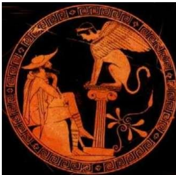
Èdip amb l'Esfinx, ceràmica àtica

L'Esfinx és una figura de la mitologia grega i egípcia. Era un monstre amb cos de lleó i rostre humà. La funció de l'esfinx era de guardiana i protectora, per això es col·locava al costat de les portes d'accés. Era dotada d'ales d'ocell de presa i està íntimament lligat a Èdip. Era filla de Tifó i Equidna, sovint s'utilitzava com a motiu decoratiu per les tombes. La bèstia vivia en les muntanyes on solia aterrar els que passaven ja que els proposava enigmes i devorava els que eren incapaços de solucionar-los.