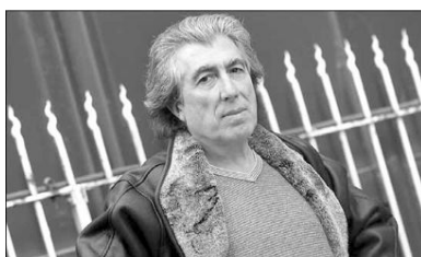
Jordi Sierra i Fabra

Un cop al parc li retreu tot i li exigeix tota la veritat. Qui era aquella noia? Es tractava d'una broma? No, no era res d'això. La noia el coneixia de l'institut i estava perdudament enamorada d'ell des de feia anys. Això no aconsegueix entendre al protagonista, el qual li prohibeix acostar-s'hi mai més. En Francesc busca, doncs, consol en el seu millor amic i la seva germana, però ambdós coincideixen: hi ha 97 maneres de dir t'estimo i totes són vàlides. Després de pensar-ho reiteradament, obre els ulls: no pot deixar escapar l'única noia a qui ha estimat.