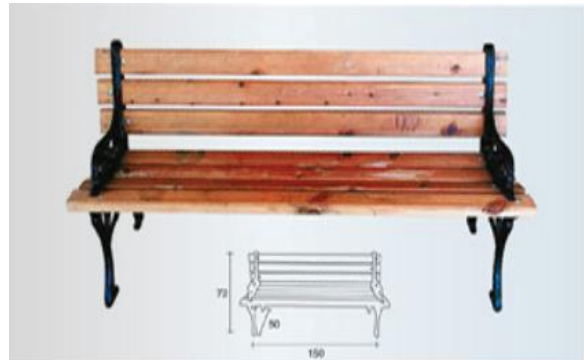
Exemple de banc