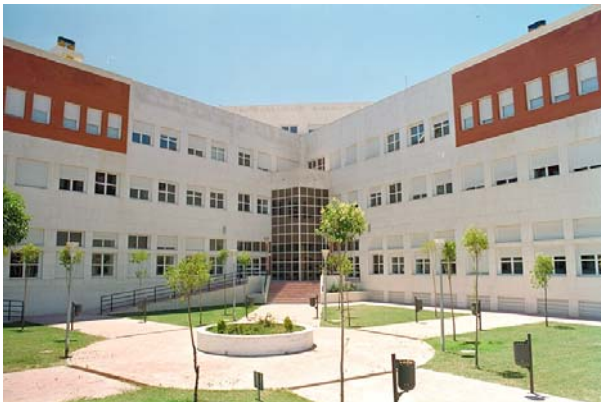
Exemple de campus universitari

PRIMER ACTE: a la primera escena ens trobem al parc, on només hi ha un banc. A partir de la segona escena ens trobarem al campus universitari, en el qual hi haurà el mateix banc que a l'escena anterior, juntament amb una impressió fotogràfica o un dibuix d'una universitat. Aquest anirà situat al fons de l'escenari.