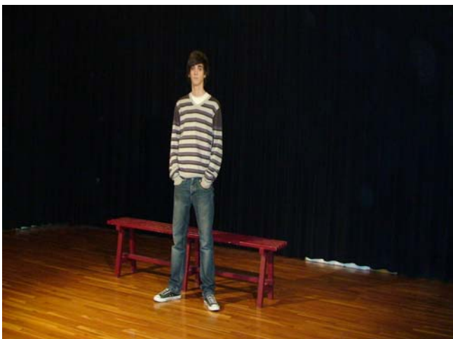
Vestuari primera escena

DANIELA: presentarà, també, dos vestuaris. Un per a la primera escena, extret del llibre, i un altre per al tercer acte, inventat. A l'escena 1, anirà vestida amb una samarreta de tirants grisa, un collaret amb un cor, una jaqueteta negra, una faldilla breu que deixa veure fins als genolls, unes mitges color pell i unes sabates negres amb un petit cinturó o llas al davant. A l'últim acte portarà una brusa rosa ajustada, uns texans i unes bambes.